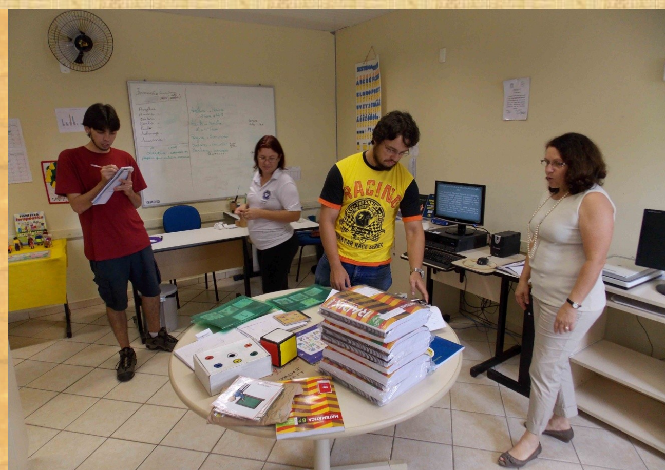
Bolsistas PIBID realizam levantamento de dados para sua atividade de Investigação do Cotidiano da Escola na sala de Multimídia.