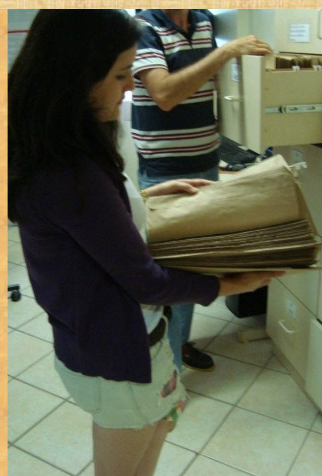
Bolsista realiza pesquisa em documentos para sua atividade de Investigação do Cotidiano da Escola, sob orientação de professor supervisor.