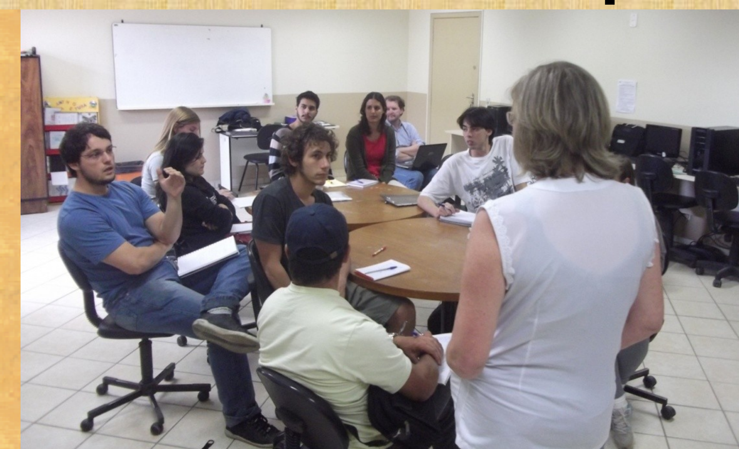
Bolsistas PIBID em discussão sobre o Projeto Político Pedagógico e Regimento da Escola.

V. A escola e as comunidades de Ribeirão da Ilha e Tapera.