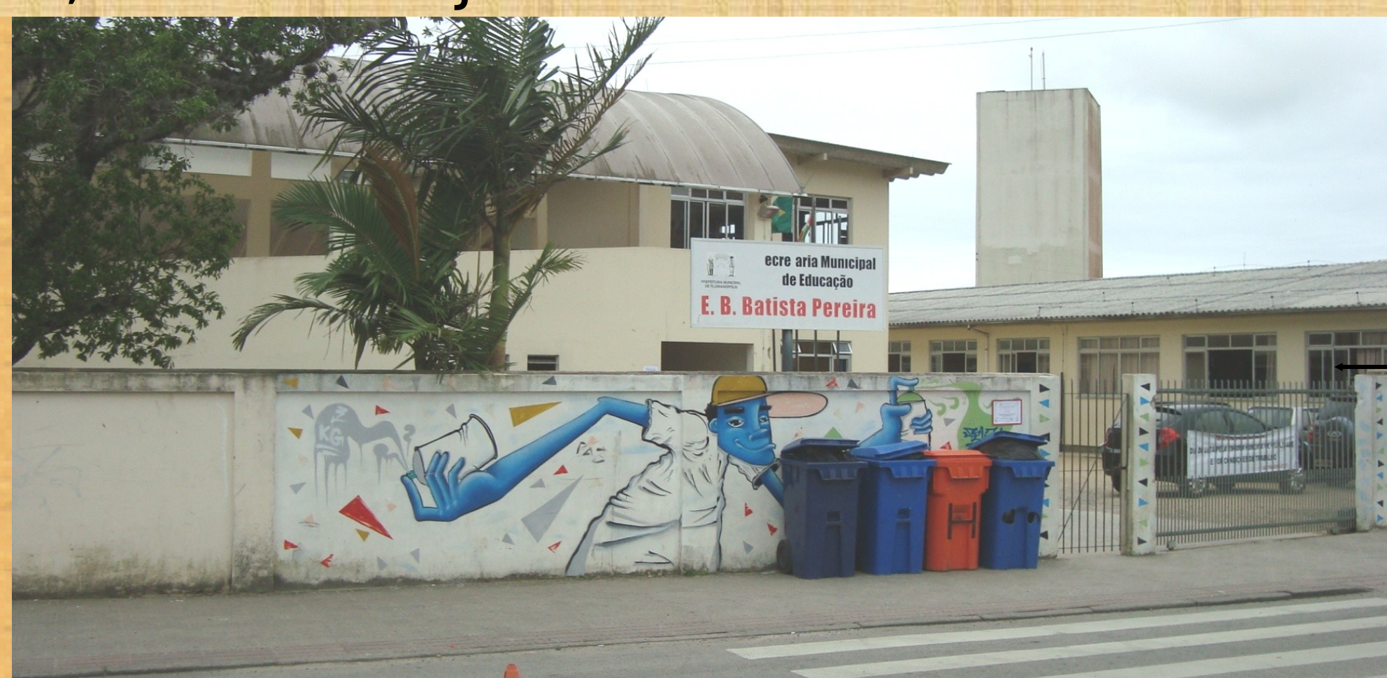
Pintura na fachada frontal da EBM Batista Pereira

De acordo com o seu Projeto Político Pedagógico, a escola foi fundada em 07 de abril de 1957, com o nome de Grupo Escolar do Alto Ribeirão. O seu nome atual é uma homenagem ao jornalista Batista Pereira. As instalações passaram por várias ampliações e reformas, com destaque para os anos de 1967, 1972, 1988 e, mais recentemente, 1995 que deixou a escola com a atual configuração física. Atualmente, a escola atende mais de 900 alunos nos anos iniciais e finais do Fundamental.