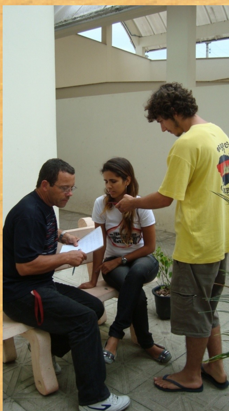
Bolsistas PIBID entrevistam funcionária da escola. Esta estratégia integra a metodologia de suas atividades de investigação do Cotidiano da Escola.

PARTICIPAÇÃO em curso de formação continuada para docentes.