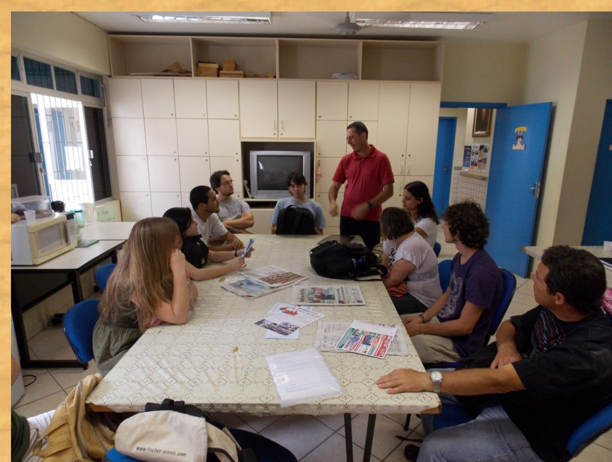
Bolsistas PIBID e Supervisores em discussão coletiva sobre as atividades de observação.