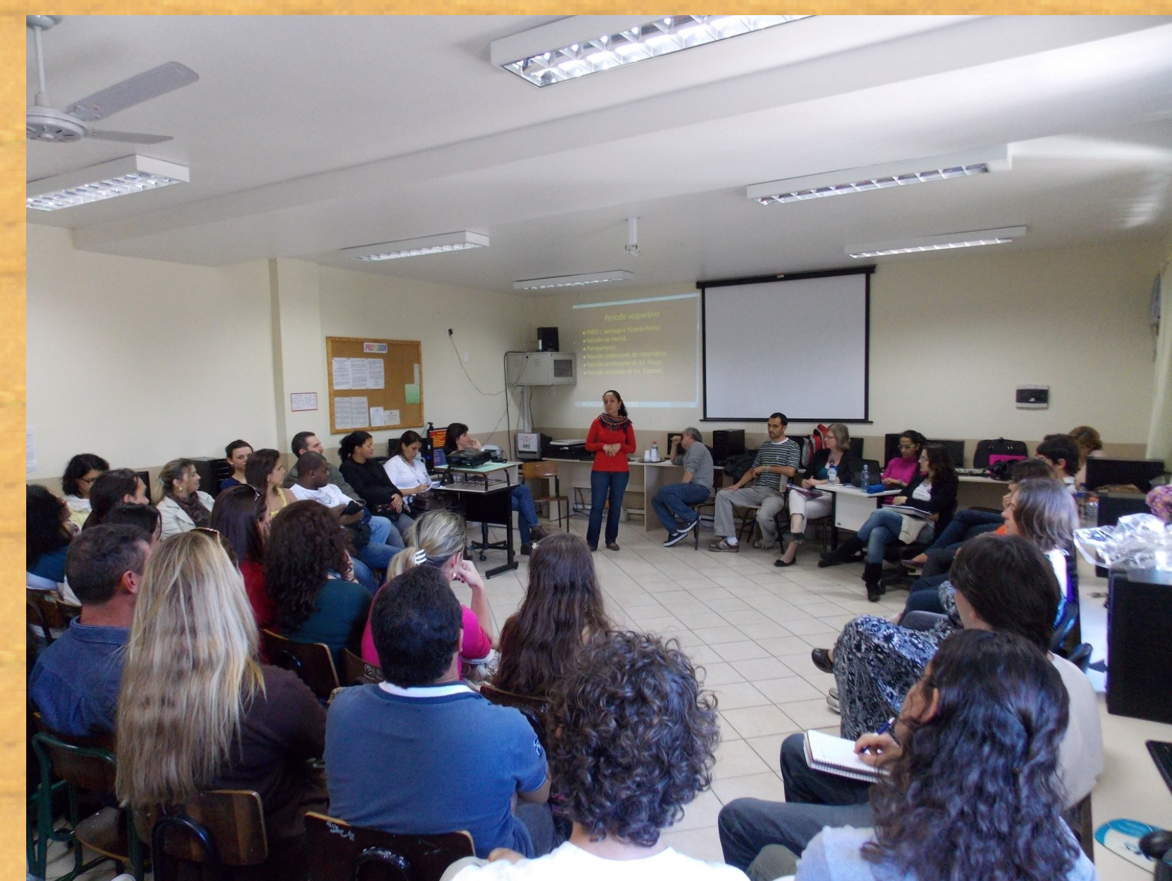
Apresentação do Projeto PIBID História e Geografia para os professores da escola durante Reunião Pedagógica.