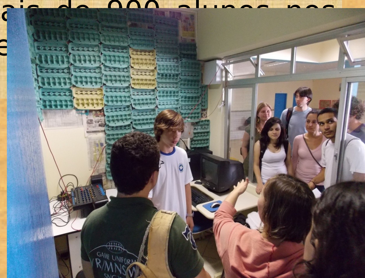
Bolsistas PIBID conhecem o Projeto da Rádio “Nova Geração” da EBM “Batista Pereira”.