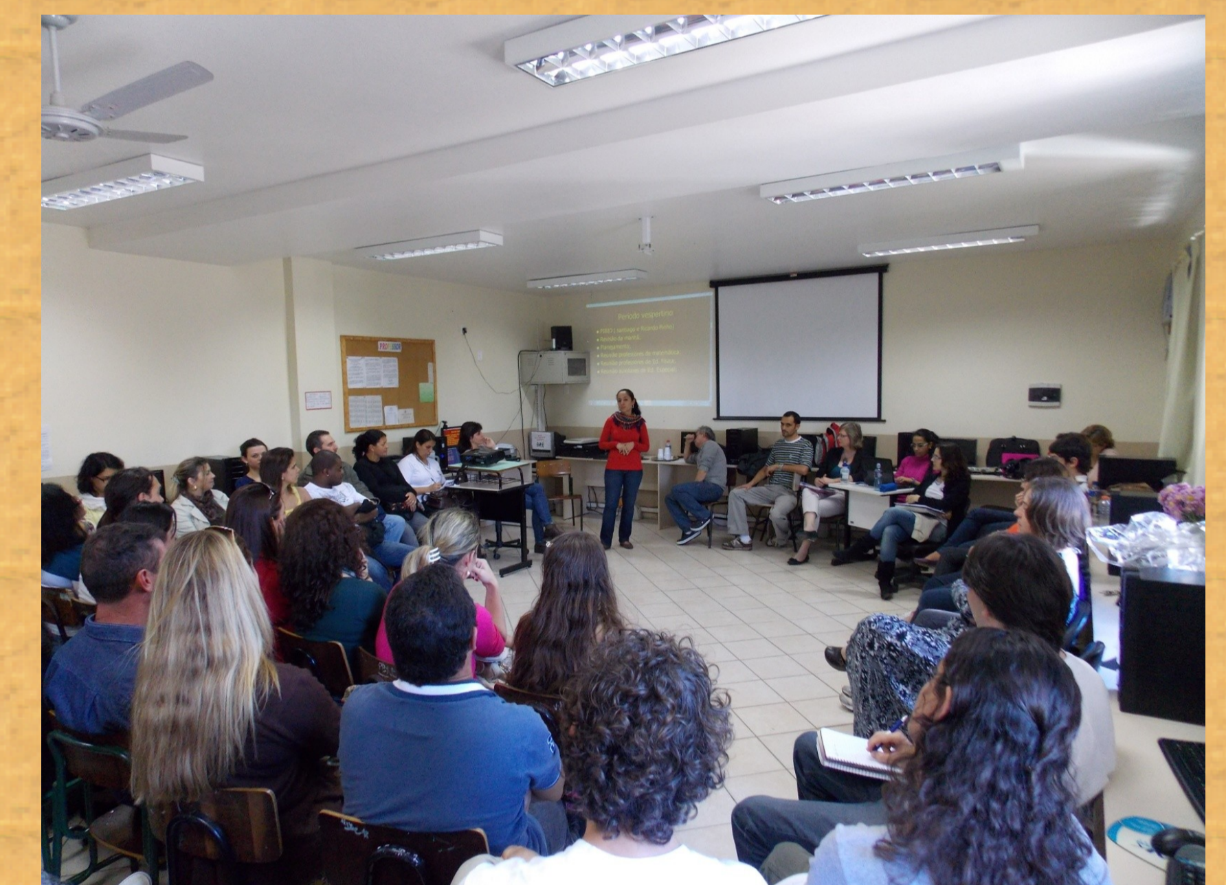
Apresentação do Projeto PIBID História e Geografia para os professores da escola durante Reunião Pedagógica.