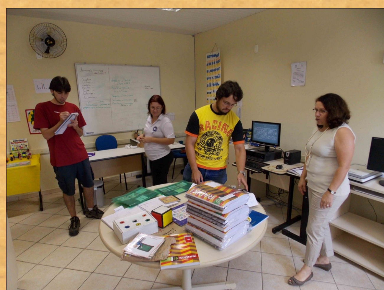
Bolsistas PIBID realizam levantamento de dados para sua atividade de Investigação do Cotidiano da Escola na sala de Multimídia.