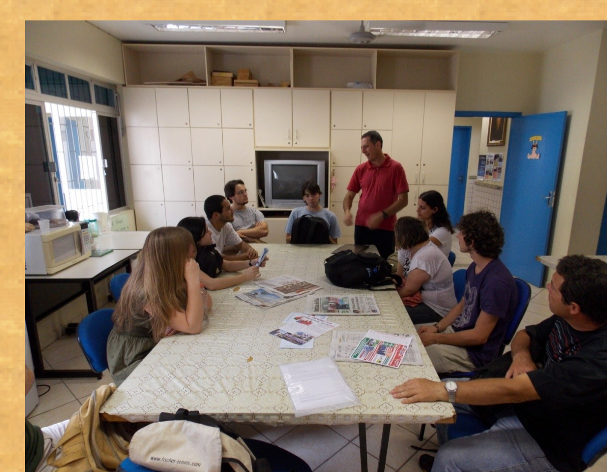
Bolsistas PIBID e Supervisores em discussão coletiva sobre as atividades de observação.