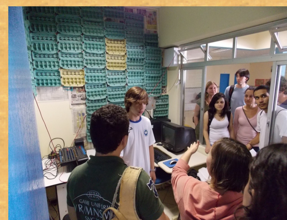
Bolsistas PIBID conhecem o Projeto da Rádio “Nova Geração” da EBM “Batista Pereira”.