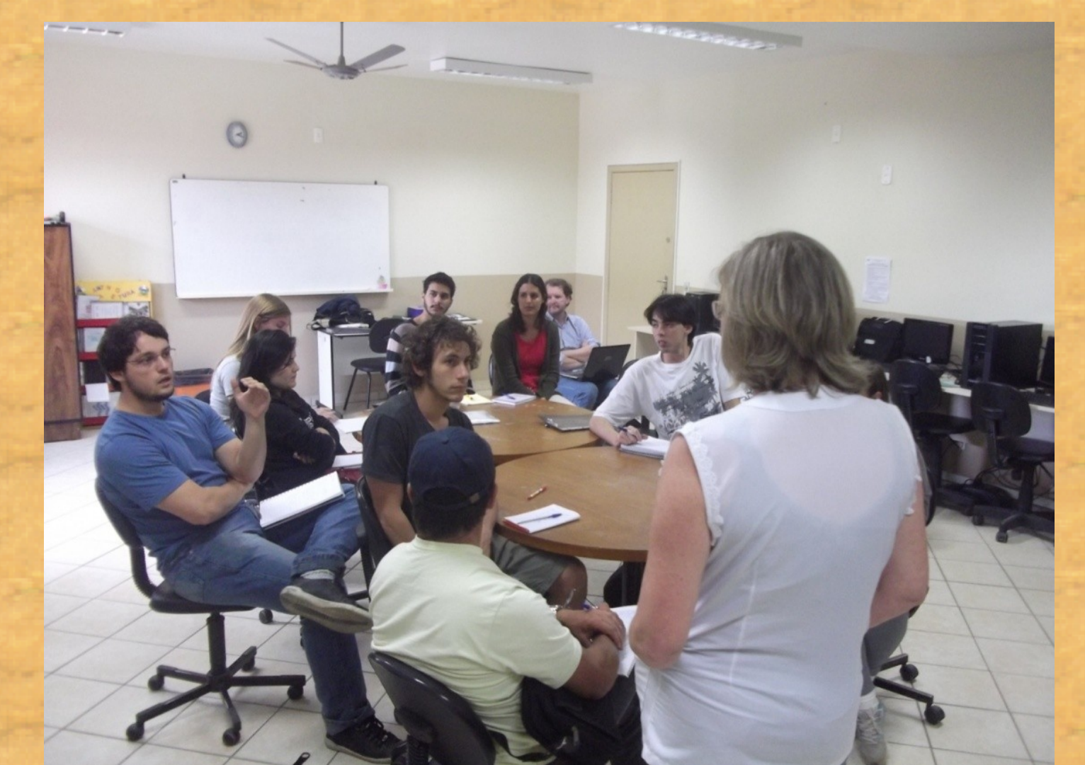
Bolsistas PIBID em discussão sobre o Projeto Político Pedagógico e Regimento da Escola.