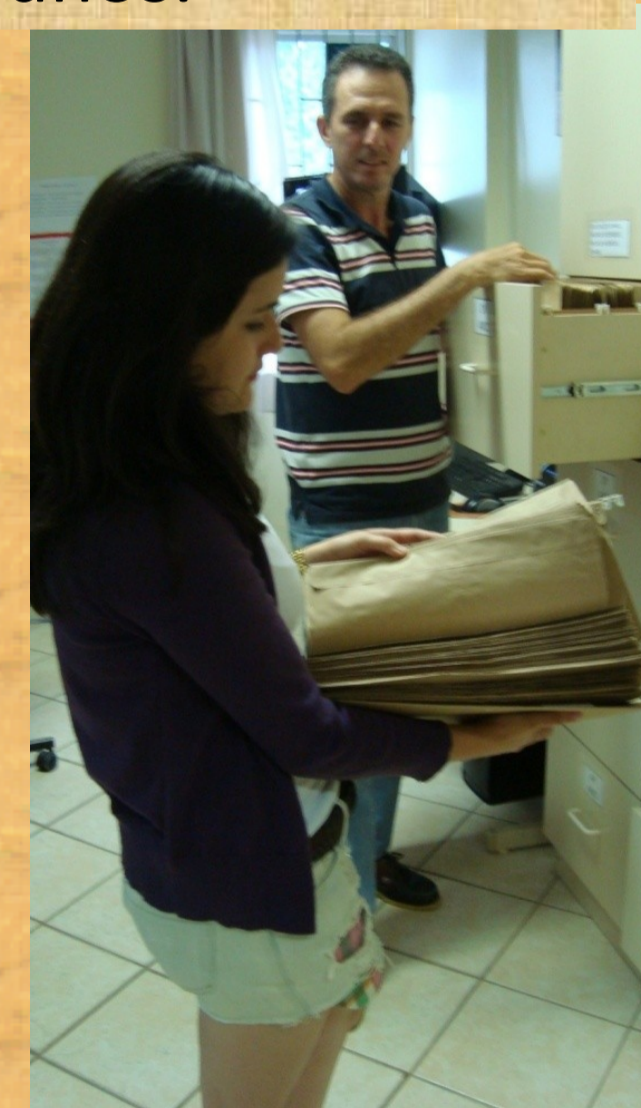
Bolsista realiza pesquisa em documentos para sua atividade de Investigação do Cotidiano da Escola, sob orientação de professor supervisor.