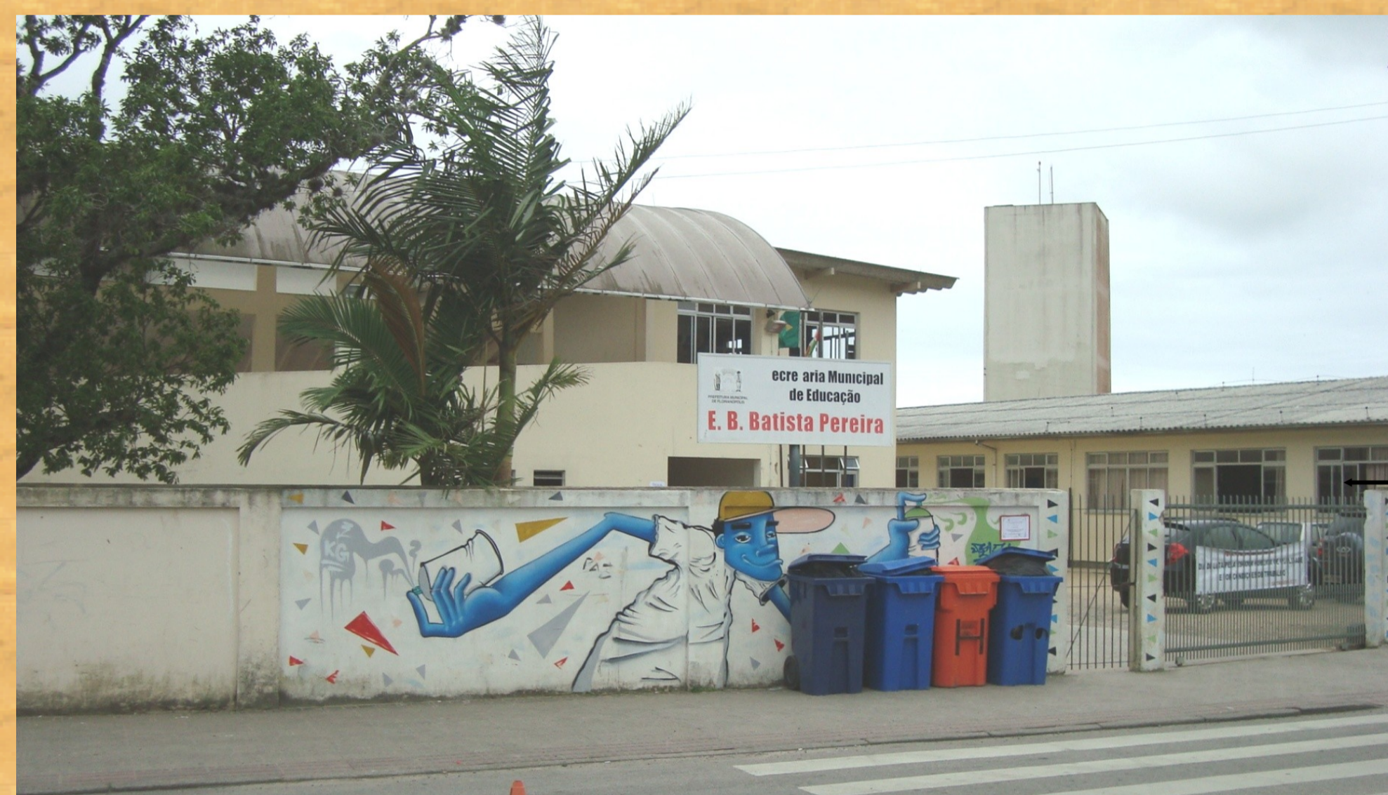
Pintura na fachada frontal da EBM Batista Pereira