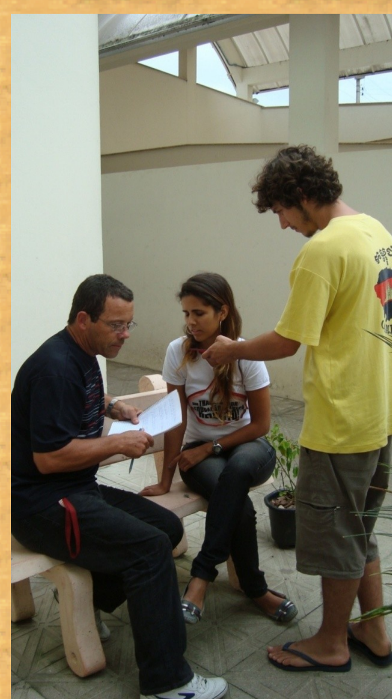
Bolsistas PIBID entrevistam funcionária da escola. Esta estratégia integra a metodologia de suas atividades de investigação do Cotidiano da Escola.

PARTICIPAÇÃO em curso de formação continuada para docentes.