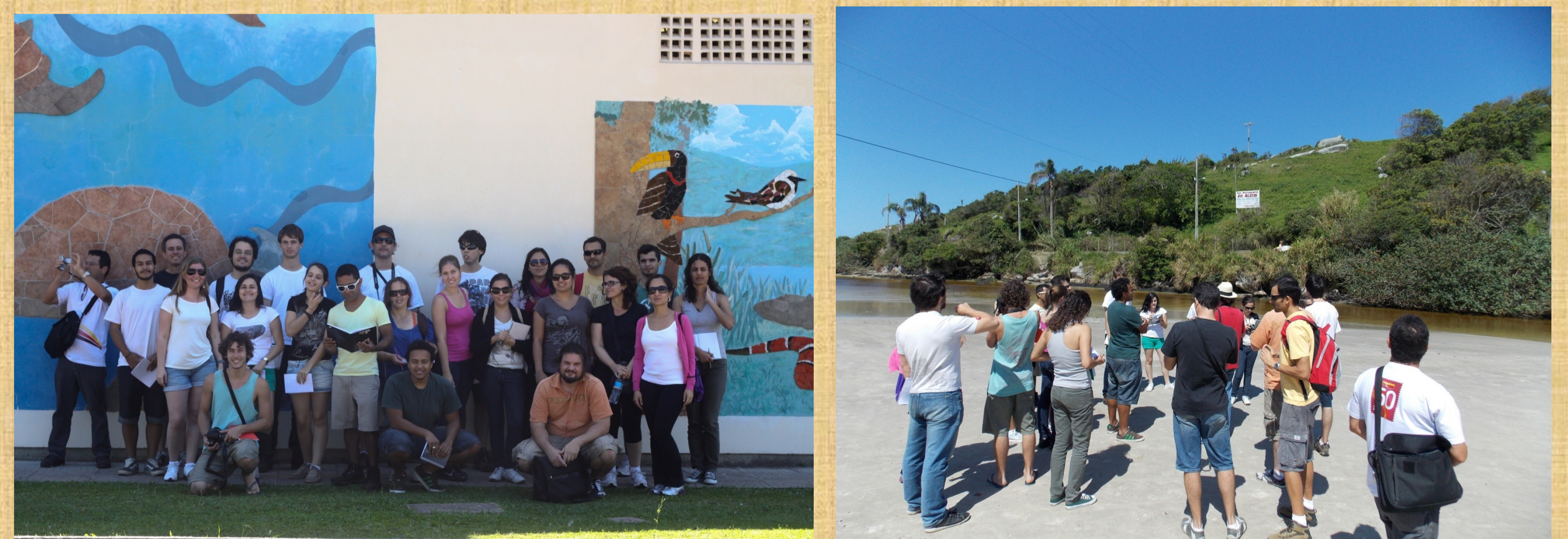
Fotos: Grupo do PIBID durante a Oficina de Reconhecimento das Localidades da Armação e Ribeirão da Ilha. Destaque para a fachada da Escola “Dilma Lúcia dos Santos” e rio Sangradouro em sua foz na praia da Armação.