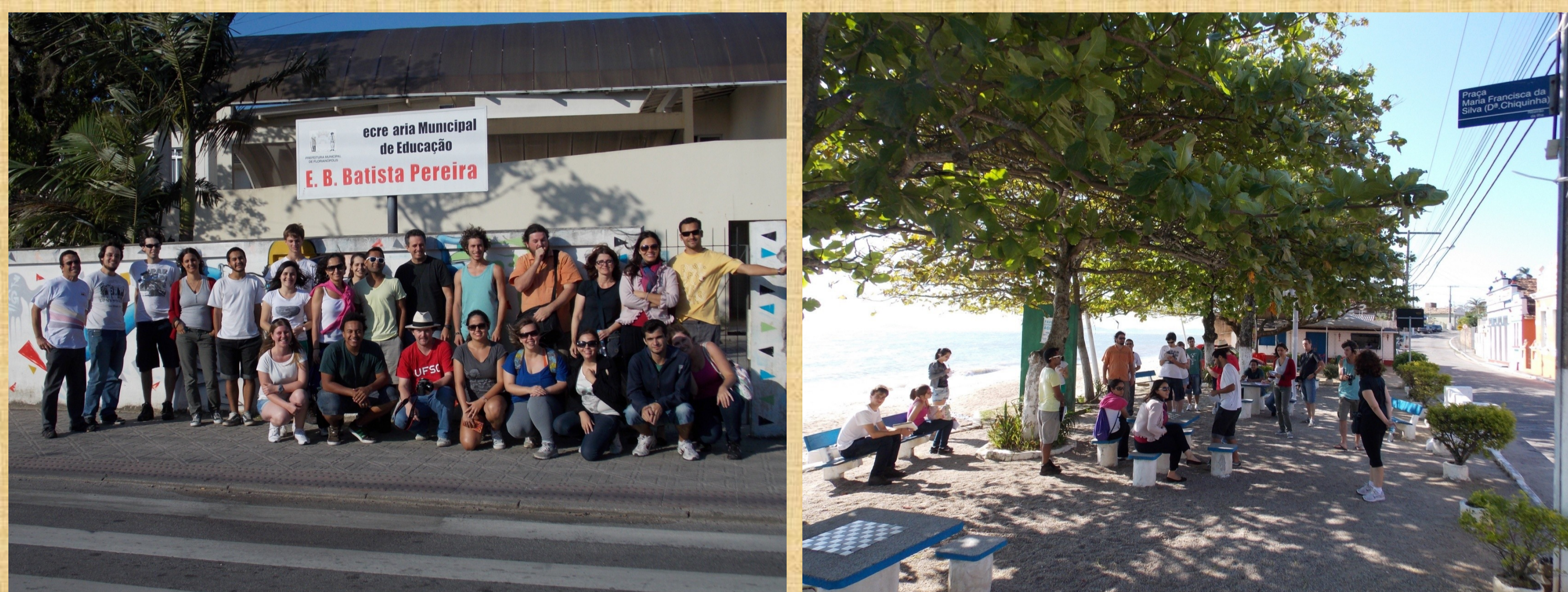
Fotos: Grupo do PIBID durante a Oficina de Reconhecimento das Localidades da Armação e Ribeirão da Ilha. Destaque para a fachada da Escola “Batista Pereira” e praça Dona Chiquinha na Freguesia do Ribeirão.

Em etapas posteriores do Projeto (2013/1) serão oferecidas outras oficinas como História Oral; Estudo do Meio; Patrimônio cultural e ambiental na Praia da Armação e no Ribeirão da Ilha; Cartografia, entre outras, que irão orientar o trabalho de pesquisa sobre as localidades circunvizinhas das escolas e a produção dos materiais didáticos.